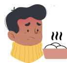
Perte de l'odorat et du goût

Les symptômes les plus courants de COVID-19 sont la fièvre, la fatigue et la toux sèche.